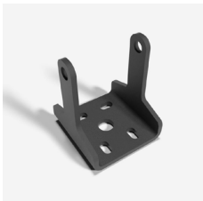
Uchwyty ścienne do HL 18-36 (2szt. / oprawę) HL 18-36 wall brackets (2 pcs / luminaire) HL 18-36 Wandhalterung (2 Stk. / Leuchte)