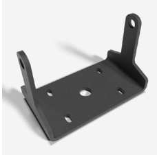
Uchwyt ścienny do HL 3-9 (1szt. / oprawę) HL 3-9 wall brackets (1 pc / luminaire) HL 3-9 Wandhalter (1 Stk. / Leuchte)